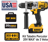
Kit Taladro Percutor 20V MAX* de 3 Velocidades