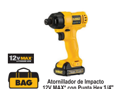
Atornillador de Impacto 12V MAX* con Punta Hex 1/4"