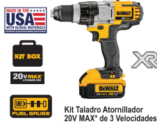
Kit Taladro Atornillador 20V MAX* de 3 Velocidades