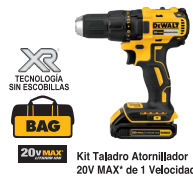
Kit Taladro Atornillador 20V MAX* de 1 Velocidad