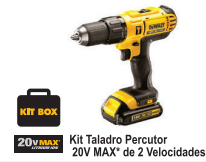
Kit Taladro Percutor 20V MAX* de 2 Velocidades