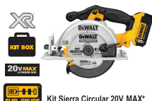
Kit Sierra Circular 20V MAX*