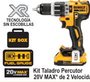
Kit Taladro Percutor 20V MAX* de 2 Velocidades