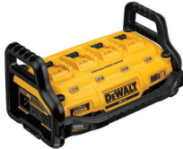
DCB1800B Estación Portátil / 1800W 4 Baterías