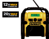
Radio/Cargador 12V MAX* y 20V MAX*