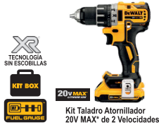
Kit Taladro Atornillador 20V MAX* de 2 Velocidades