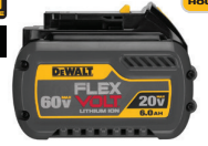
DCB606 20V MAX* Batería de Ión de Litio