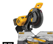
Sierra Ingleteadora de 12" Telescópica doble bisel