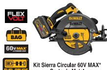
Kit Sierra Circular 60V MAX* Corte de Metal