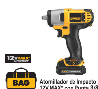
Atornillador de Impacto 12V MAX* con Punta 3/8"