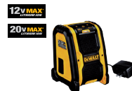
Parlante Bluetooth 30 Mts