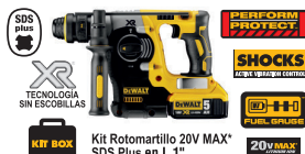
Kit Rotomartillo 20V MAX* SDS Plus en L 1"