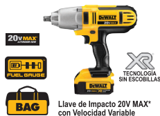
Llave de Impacto 20V MAX* con Velocidad Variable