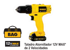
Taladro Atornillador 12V MAX* de 2 Velocidades