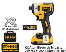
Kit Atornillador de Impacto 20V MAX* con Punta Hex 1/4"