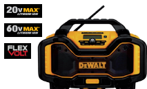
Radio cargador 20V MAX* y 60V