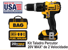
Kit Taladro Percutor 20V MAX* de 2 Velocidades