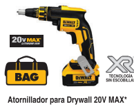
Atornillador para Drywall 20V MAX*