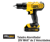
Taladro Atornillador 20V MAX* de 2 Velocidades