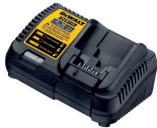
DCB115 Cargador Multivoltaje