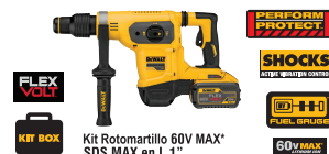
Kit Rotomartillo 60V MAX* SDS MAX en L 1"