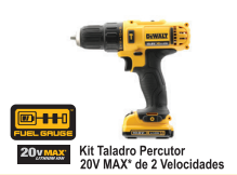
Kit Taladro Percutor 20V MAX* de 2 Velocidades