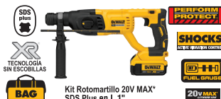
Kit Rotomartillo 20V MAX* SDS Plus en L 1"