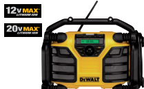
Radio/Cargador 12V MAX* y 20V MAX*